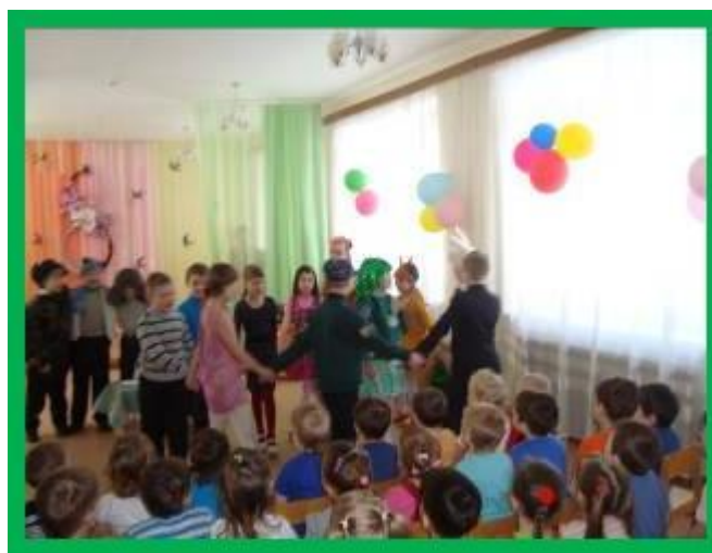
Выступление в детском саду №34 «Теремок»