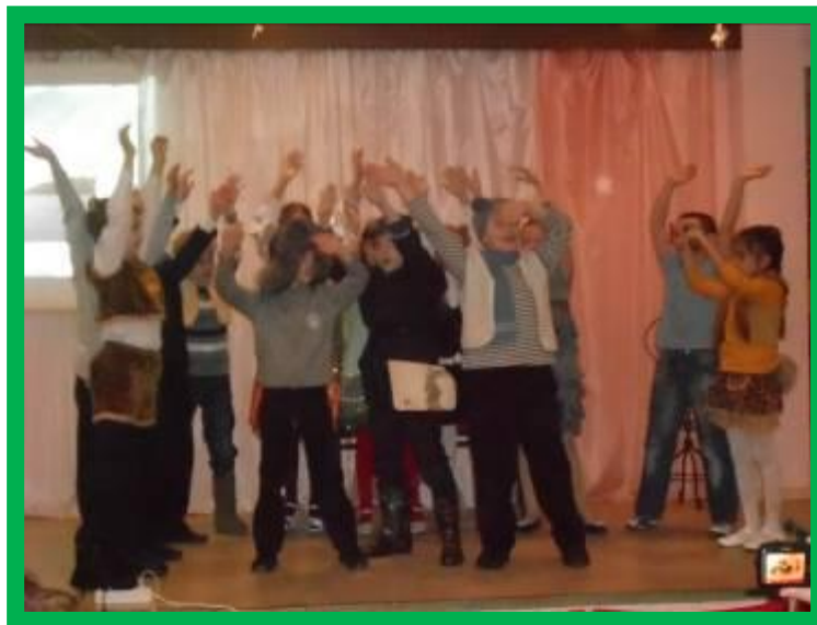
Выступление во Дворце Книги

Наступил однажды праздник - Новый год. И меня срубили - нужен хоровод.