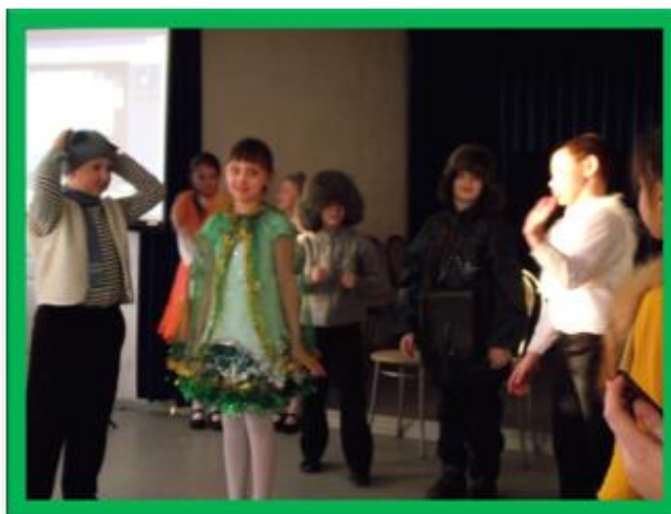
Выступление в центре «Доверие»