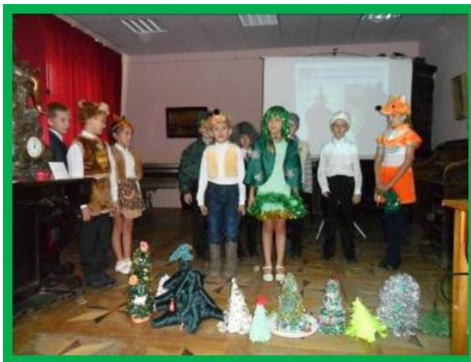
Выступление в городском Краеведческом музее

Дарим вам на память веточки сосны, Простоят они у вас в доме до весны.