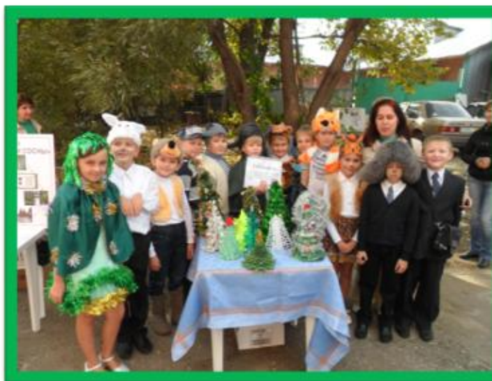
Выступление со сказкой на II Зональном музейном фестивале «Три сосны»